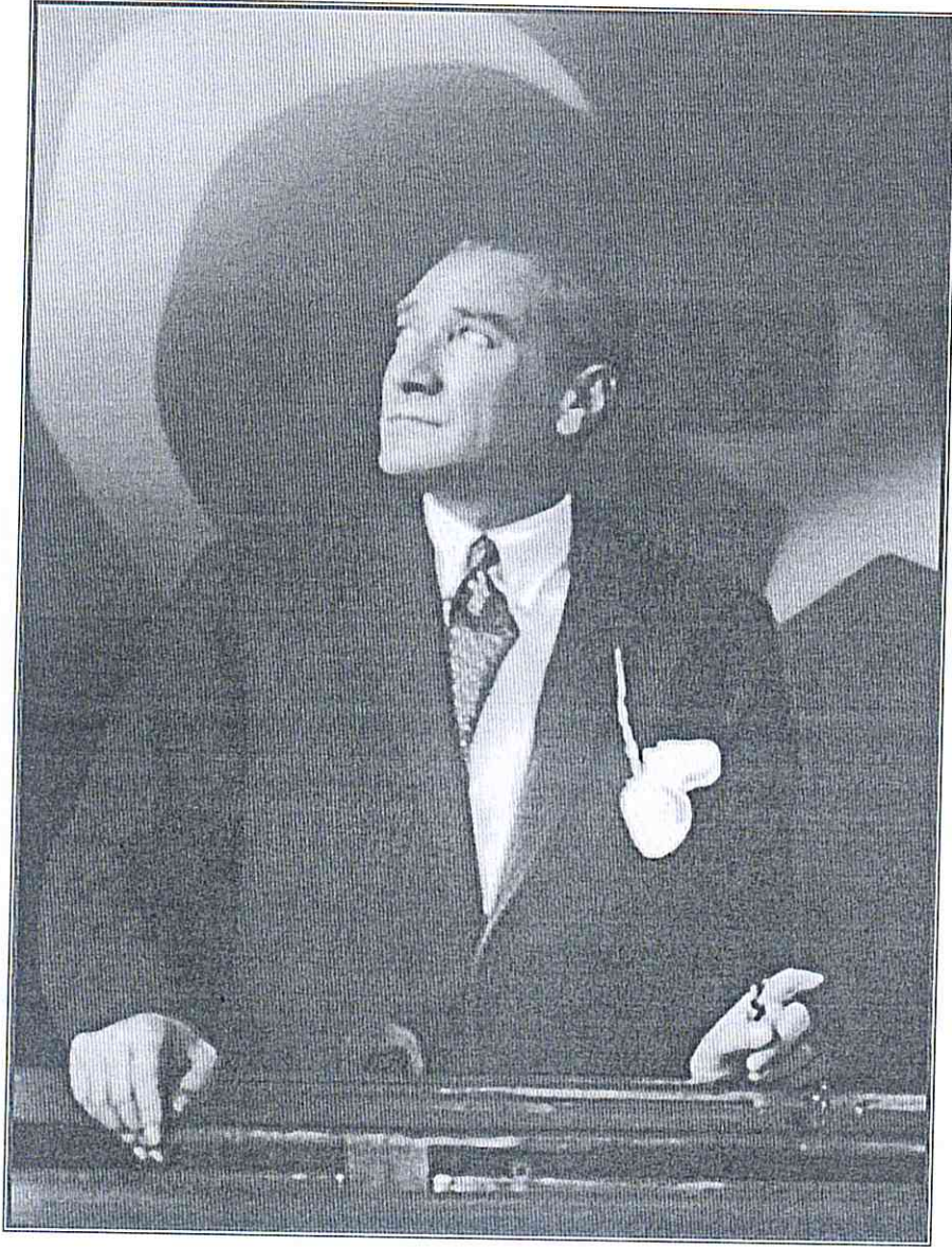
Mustafa Kemal ATAT¼RK

“Çalıřmadan, yorulmadan, üretmeden, rahat yaşamak isteyen toplumlar, önce haysiyetlerini, sonra hürriyetlerini ve daha sonrada istiklal ve istikballerini kaybederler”.